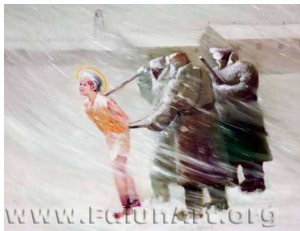
油画《风雪中》，作者：姚重琪，作于 2004 年。

“追查国际”从即日起对涉案主要责任单位和责任人进行全面追查，进一步核查其犯罪事实。本组织欢迎知情人收集保存上述人员的犯罪事实和证据（包括文字、图片、录音、录像等）及其贪污腐败、拥有不法资产及海外资产（无论以何种方式藏匿转移）的情况，以安全可靠的方式送交本组织。◇