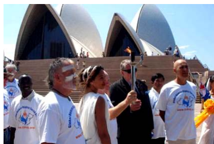
人权圣火经过澳洲悉尼歌剧院