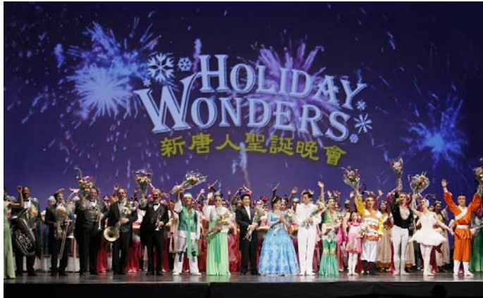
新唐人圣诞晚会 18 日首演于纽约百老汇碧肯剧院，演出反响热烈，演员谢幕。

这台溶合东西方经典文化艺术的国际一流演出，意境深远的构思，美妙轻盈的中国古典舞，纯净华美的音乐，响彻云霄的歌声，壮观生动的天幕，都在演绎着纯真、纯善、纯美的神传文化，释放着无限慈悲的能量，震撼着每一个人的心灵。演出结束后，好评如潮。