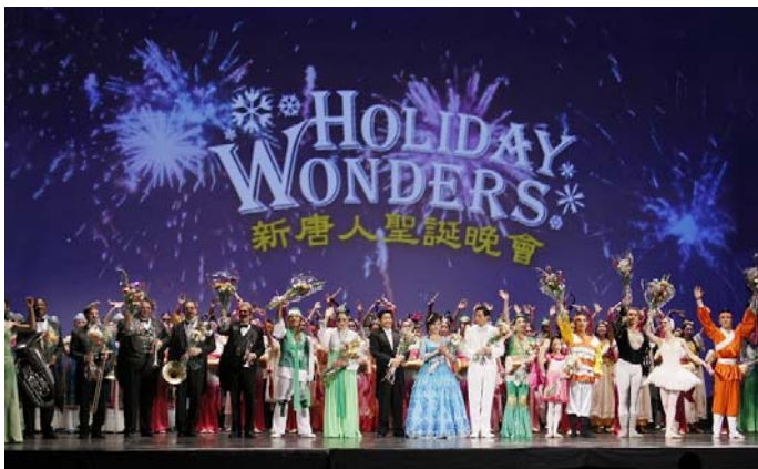
新唐人圣诞晚会 18 日首演于纽约百老汇碧肯剧院，演出反响热烈，演员谢幕。

这台溶合东西方经典文化艺术的国际一流演出，意境深远的构思，美妙轻盈的中国古典舞，纯净华美的音乐，响彻云霄的歌声，壮观生动的天幕，都在演绎着纯真、纯善、纯美的神传文化，释放着无限慈悲的能量，震撼着每一个人的心灵。演出结束后，好评如潮。