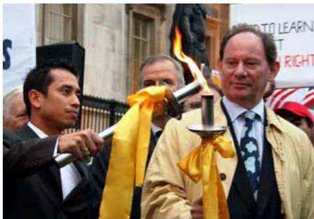
英国伦敦人权圣火传递仪式

【明慧网】人权圣火传递活动是由全球三百多名政要、医生、律师等组成的“法轮功受迫害真相联合调查团”发起，在全球巡回传递，目的是呼吁国际社会关注中国恶劣的人权状况、尤其是中共对法轮功的迫害，拒绝让象征人类和平自由的奥运变成中共实行独裁和镇压的“血腥奥运”。人权圣火于八月九日在希腊点燃，至今已途经十八个国家的二十五个城市。零七年十月二十五日，人权圣火全球传递活动抵达英国伦敦。