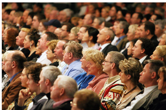
聚精会神观看2007年神韵晚会的西方观众

神韵艺术团主演的晚会以表现中国神传文化为主，主要演员和工作人员均为世界各地法轮功学员，至今已举办五届。2007年神韵晚会在全球四大洲、30多个城市巡回，所到之处反响极其热烈，被誉为“中华传统文化的复兴”、“中华文化新的经典”。成为海外炎黄子孙的骄傲。