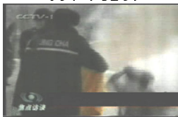
3、手摸被打后的头部