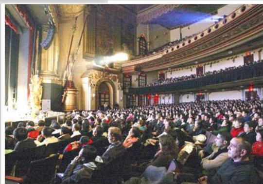
纽约百老汇现场观众

纽约圣诞晚会将连演十场，随后神韵艺术团将应各地热邀，在全球六十余个城市巡回表演，据神韵艺术团发布资料显示，预计届时全球将有六十五万现场观众。◇