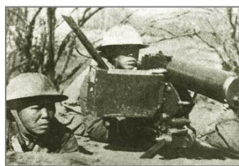
国军将士在台儿庄外围阻击进犯的日军

说共产党“假抗日、真内战”，我深有体会。中共宣称是它领导全国人民打败了日本人。但是，大量史料爆出中共有意不参与当时的抗日战争，并趁国民党抗战之际，积蓄力量，拖抗日战争的后腿。共产党高举抗日大旗，却只在后方收编地方军和游击队，除了平型关等几个屈指可数的对日战斗外，共产党无抗日战绩可言，