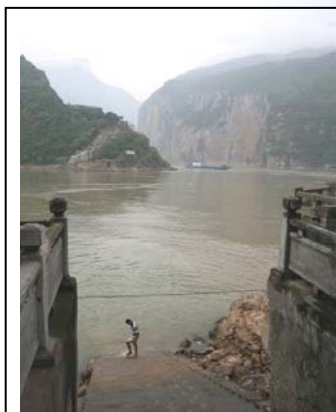
长江三峡瞿塘峡是主要旅游胜地之一。当三峡大坝水库的水平面到达 175 米(574 英尺)，沿着长江的许多其它城市，将被淹没在大坝水库下。

中共建三峡，将中华民族巴山蜀水风流之地尽毁其中。它断了民族的龙脉，断了民族的香火，乃千古之罪人，中共也将成为三峡的祭品。当然，最终的遭受灾难还是中华民族和他的百姓。