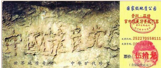
▲掌布风景区门票上“中国共产党亡”的照片

二零零二年六月，在贵州平塘县发现的亿年“藏字石”（下图），五百年前崩裂惊现“中国共产党亡”。这一切其实都是在告诉人们“天灭中共”的天象，希望人们能够“退党保平安”。