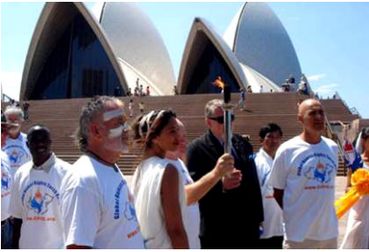
人权圣火经过澳洲悉尼歌剧院

二零零七年十月二十七日，人权圣火于上午十点左右到达澳洲悉尼市，多名澳洲政要、社区和人权团体的代表共同在悉尼市政厅前举行圣火迎接仪式，之后又在悉尼歌剧院附近的First Fleet公园举行了欢迎仪式和文艺表演等活动，近千名澳洲民众参加了人权圣火的欢迎活动。欢迎活动吸引了十多家中英文媒体前来采访报道。