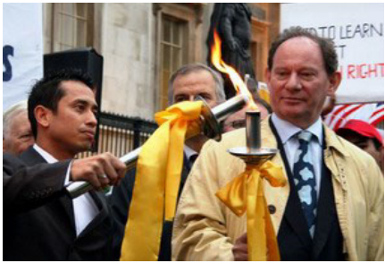
英国伦敦人权圣火传递仪式

人权圣火传递活动是由全球三百多名政要、医生、律师等组成的“法轮功受迫害真相联合调查团”发起，在全球巡回传递，目的是呼吁国际社会关注中国恶劣的人权状况、尤其是中共对法轮功的迫害，拒绝让象征人类和平自由的奥运变成中共实行独裁和镇压的“血腥奥运”。人权圣火于八月九日在希腊点燃，至今已途经十八个国家的二十五个城市。零七年十月二十五日，人权圣火全球传递活动抵达英国伦敦。