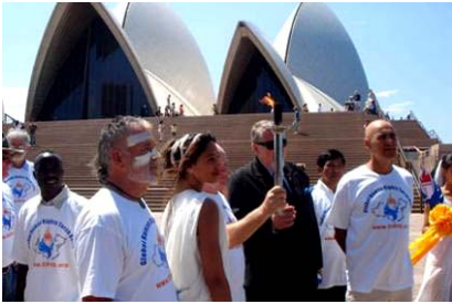
人权圣火经过澳洲悉尼歌剧院

二零零七年十月二十七日，人权圣火于上午十点左右到达澳洲悉尼市，多名澳洲政要、社区和人权团体的代表共同在悉尼市政厅前举行圣火迎接仪式，之后又在悉尼歌剧院附近的 First Fleet 公园举行了欢迎仪式和文艺表演等活动，近千名澳洲民众参加了人权圣火的欢迎活动。欢迎活动吸引了十多家中英文媒体