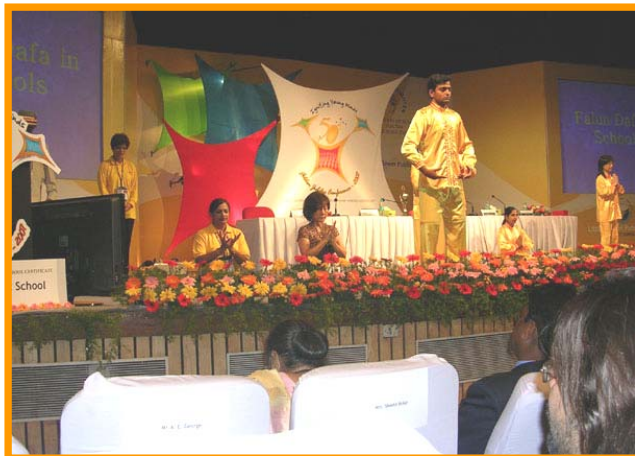
▲法轮功学员表演五套功法

【明慧网二零零七年十二月五日】印度全国学校协会于印度南部 BANGALORE 举办五十周年盛大庆典，来自印度全国表现绩优的私立学校校长，聚集到 BANGALORE 来参加庆祝大会及印度学校绩优文凭颁发典礼。其中 VERKEY 校长在会议上特别提出学炼法轮功令全体师生在生活及学业上有明显改变，让与会校长眼睛一亮，引起热烈回响。