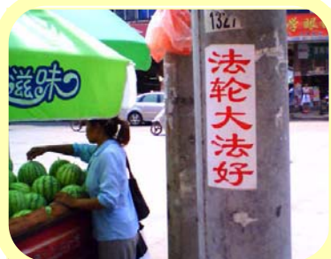
图摄于湖北黄梅县。在大陆乡村，有的整条街巷都可看到“法轮大法好”，这些真相福音不知迎来送往了多少有缘的乡亲。