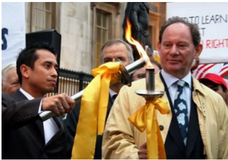
英国伦敦人权圣火传递仪式

名政要、医生、律师等组成的“法轮功受迫害真相联合调查团”发起，在全球巡回传递，目的是呼吁国际社会关注中国恶劣的人权状况、尤其是中