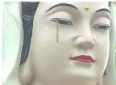
台湾观世音像流泪

二零零二年三月十九日，澳洲的一尊圣母像显神迹，泪水不断。二零零二年七月，以色列圣城耶路撒冷出现极为不寻常的现象，著名哭墙的一块石块竟流出泪水般的水渍。二零零三年一月十七日发现高雄市一尊观世音佛像右眼下方突然出现一条泪痕(右图)，数次下雨都未能冲掉。