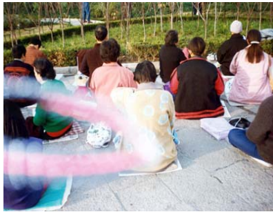
能量场——法轮功学员炼功时拍到的奇妙景象

在日常工作中，我也以“真、善、忍”的标准要求自己，不随波逐流。作为学院院长，经常碰到拉关系、收礼送礼等事，我都拒绝了。连单位评职称、申请项目经费等，我也按修炼人的标准，劝告我