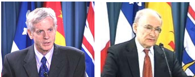
加拿大调查员大卫·乔高 和 大卫·麦塔斯

【明慧网】经过近半年的继续深入调查，加拿大调查员大卫·麦塔斯和大卫·乔高收集到更多确认中共活体摘取法轮功学员器官的真实性的证据。电