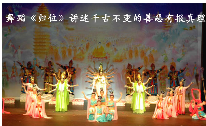
舞蹈《归位》讲述千古不变的善恶有报真理

今天，贵州平塘的“藏字石”是否也在向人们预示着天机呢？回想一下，共产党与秦朝的暴政多么相似。《九评共产党》一书全面揭开了共产党的邪恶本质，并在全球掀起了退党大潮，至今已有一千八百多万中国大陆民众声明退出党、团、队组织，顺应了天意，也为自己选择了光明的未来。◇