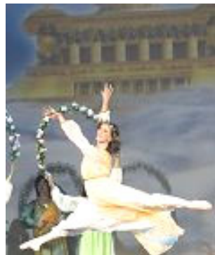
▲舞蹈《誓约》：慈悲的神立誓下世救人，为人类有得救的机会而欢庆。

以展现中华神传文化为主题的第四届“新唐人全球华人新年晚会”二零零七年在世界三十个大城市上演，节目精彩绝伦，展现的慈悲、纯正、沁人心脾的力量撼动着观众的心。