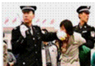
人们说真话的权利被剥夺

《九评共产党》一书深刻揭露了中共邪恶本质，到2007年2月7日已有超过1828万中国民众在海外大纪元网站声明退出中共党、团、队。其中包括中共党政军高层内的党员。