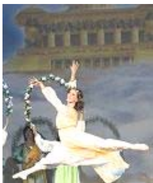
▲舞蹈《誓约》：慈悲的神立誓下世救人，为人类有得救的机会而欢庆。

以展现中华神传文化为主题的第四届“新唐人全球华人新年晚会”二零零七年在世界三十个大城市上演，节目精彩绝伦，展现的慈悲、纯正、沁人心脾的力量撼动着观众的心。