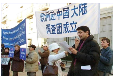
真相调查团欧洲分团二月三日在伦敦中使馆前举行新闻发布会，宣布正式成立。