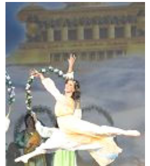
▲舞蹈《誓约》：慈悲的神立誓下世救人，为人类有得救的机会而欢庆。

著名女低音歌唱家杨建生演唱的歌曲之一《天安门广场，请你告诉我》，触动很多观众的内心深处，人对神传文化的直接感受，语言已不是障碍，每场都有观众听后起立鼓掌，东西方观众感动的落泪。