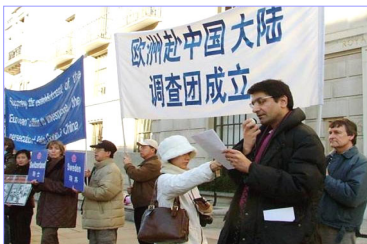
真相调查团欧洲分团二月三日在伦敦中使馆前举行新闻发布会，宣布正式成立。

调查员：我们有个亲戚在沈阳那边的，他说是好象那种肾脏比较用的多，质量好一些吧。就是法轮功的那种，是不是？你也用的这种？