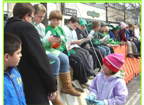
孩子们在阅读法轮功传单