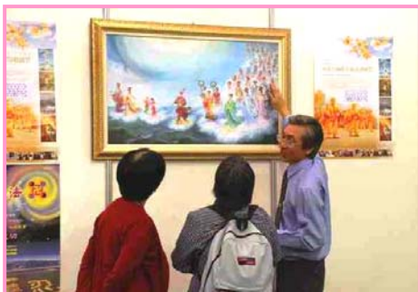
▲导览人员解说画作

“美展”的内容包括油画和中国画等四十几幅作品，是由一群来自不同背景、卓有成就的艺术家创作的，目前