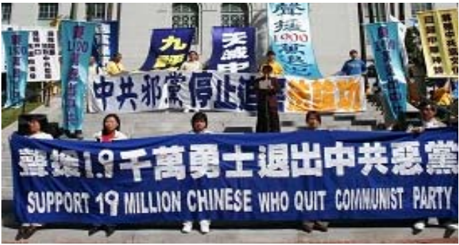
三月三日美国洛杉矶民众集会游行庆祝 一千九百万 中国人退出中共党、团、队