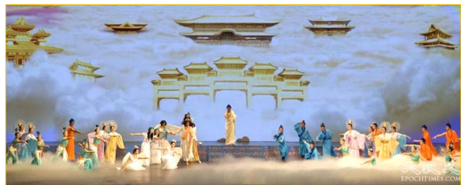
《创世》：慈悲的主佛率众神佛下世，为苍宇众生开创美好的未来。

当大幕徐徐拉开，一个辉煌、殊胜的神界天国景象展现在观众眼前，亭台楼阁、云雾缭绕，佛光神气、纯清透明。众佛、道、神各具神采，祥和美妙、庄严圣洁。这就是引人瞩目的新唐人纽约晚会的开场节目——舞剧《创世》的最初一幕。此景令现场观众不觉齐声惊叹，之后，全场掌声雷动。