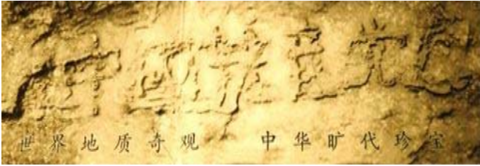
贵州平塘县掌布乡风景区门票

一块巨石，不知何时从石壁坠落，崩裂为两半。石长各为7米，高3米，重百余吨，静卧于贵州平塘县掌布乡。