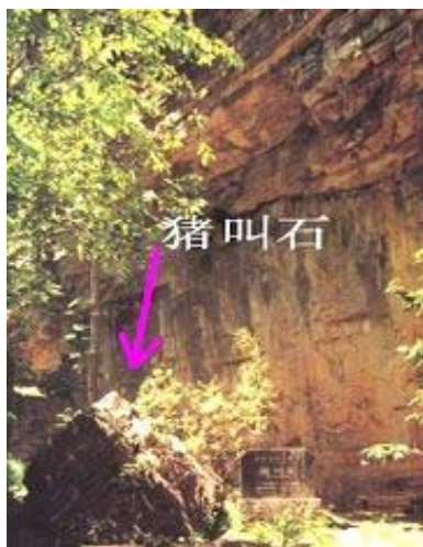
每逢世上有大事发生，这块石头就会叫

过去曾有记者报道过，有关资料记载过（网上可查），有关专家曾探测过，都因无法解释不了了之”。