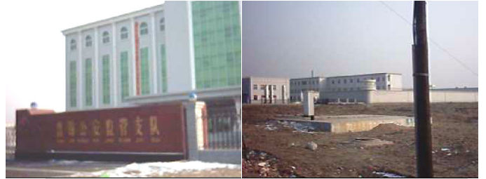
以上图一、图二均为辽宁盘锦市看守所