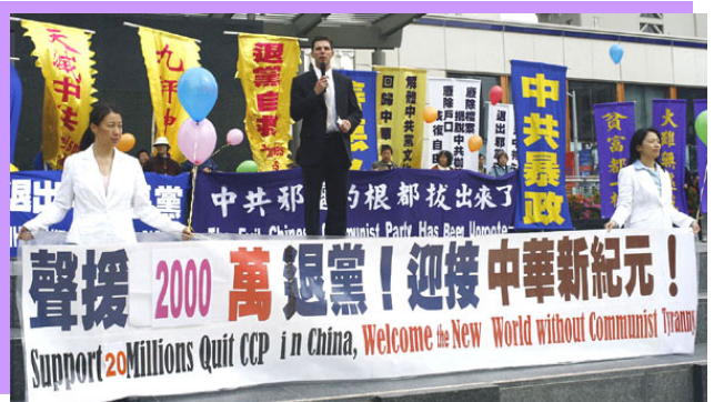
零七年三月二十四日美国旧金山举行声援两千万中国人退出中共的活动

文章引用了调查报告中调查小组给中国打电话的对话，一个移植中心的医生承认，现在就有年轻的法轮功学员的器官。另一位外科医生表示，广州的医院有来自健康的法轮功学员的器官，他们都是三十多岁，“我们只挑选好的，因为我们得保证器官移植的质量”。◇