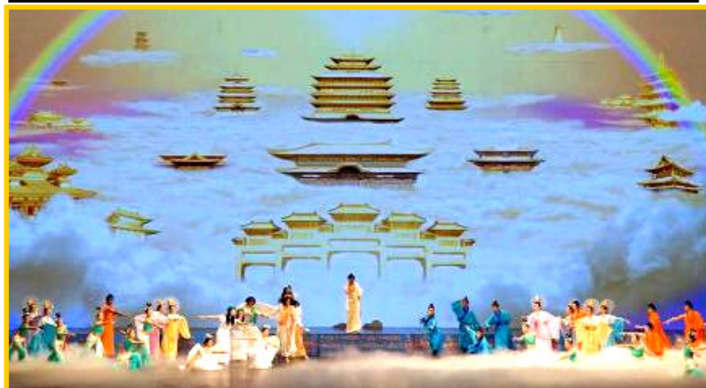
▲全球华人新年晚会美国纽约首场大型舞蹈《创世》剧照