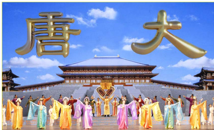
▲全球华人新年晚会纽约首场大型舞蹈《创世》剧照

【明慧网】二零零七年二月十四日晚，新唐人全球华人新年晚会经北美十多个城市的巡回后，再次在世界之都纽约城拉开了七场演出的帷幕。演出表达了中华民族天人合一，神传文化博大精深的内涵，晚会以“创世”开幕，辉煌的天国，盛世的大唐，天上人间。正是“天乐下凡为哪般，主佛慈悲创世纪”。