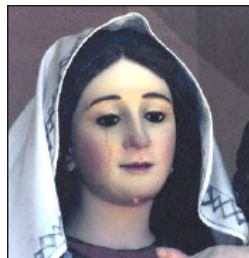
澳洲一尊哭泣的 圣母像

近年世界各地都有很多关于圣玛丽娅像、耶稣像、圣婴像流泪的新闻报道。报道说这些圣像流出带有血的泪，科学家经过化验，发现血里含有和人的血相同的成份，但是无法发现这些血、泪从何而来，也解释不了为什么这些神的雕像会流泪、血的原因。