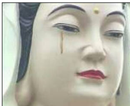
台湾高雄市流泪的 观世音佛像

找寻真相、摆脱中共，心灵的自救才能达到肉体 and 生命的自救。神佛在通过各种方式警示人们，摆脱劫难的方式。清醒吧，还对中共抱有幻想的中国人，不要在大难来临之时无助的哭泣。◇