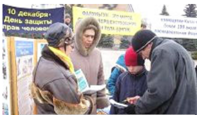
人们纷纷签名谴责中共，支持法轮功反迫害

二零零七年二月二十四日下午，俄罗斯法轮功学员在莫斯科举行集会，揭露中共邪恶政权残酷迫害法轮功学员，特别是活摘法轮功学员器官牟利的滔天罪行。当天的莫斯科天气格外寒冷，值班的警察呆在面