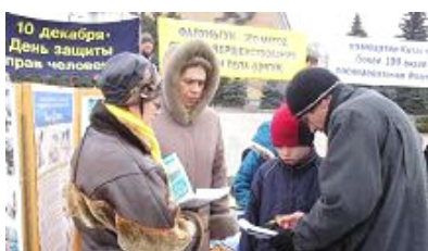
人们纷纷签名谴责中共，支持法轮功反迫害

二零零七年二月二十四日下午，俄罗斯法轮功学员在莫斯科举行集会，揭露中共邪恶政权残酷迫害法轮功学员，特别是活摘法轮功学员器官牟利的滔天罪行。当天的莫斯科天气格外寒冷，值班的警察呆在面