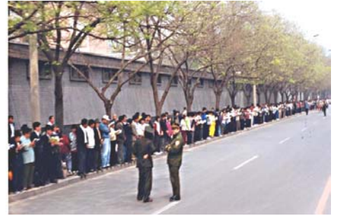
上访学员安静祥和没有阻塞交通 警察没事闲聊

罗干设下圈套 ，事先封闭各路口唯独留下中南海一条路，公安人员刻意指领导学员分为两路把中南海围成一圈，形成所谓的“包围中南海”进行栽赃陷害。