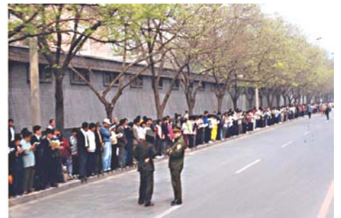
上访学员安静祥和没有阻塞交通 警察没事闲聊

罗干设下圈套 ，事先封闭各路口唯独留下中南海一条路，公安人员刻意指领导学员分为两路把中南海围成一圈，形成所谓的“包围中南海”进行栽赃陷害。