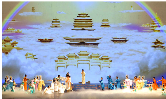
晚会开场节目《创世》：主佛率众神下世，为众生开创美好的未来。