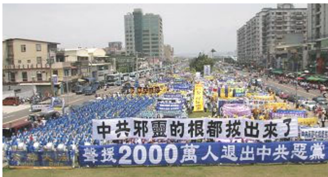
世界各地民众游行庆祝退党团队人数超过二千万

三天之后验收结果的时候到了。工匠们敲锣打鼓的庆祝着工程的完成，他们用了非常多的颜料，以非常精巧的手艺把寺庙装饰得五颜六色。而和尚们所整修的寺庙，没有涂任何的颜料，只是所有的墙壁、桌椅、窗户等等都被擦拭得非常干净，寺庙中所有的物品都显出了它们原来的颜色，而它们光泽的表面就像镜子一般，无瑕的反射出外面的色彩，天边多变的云彩、随风摇曳的树影，甚至对面五颜六色的寺庙，都