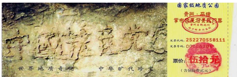
二零零二年六月，在贵州省平塘县掌布乡发现自然形成的藏字石：中国共产党亡。巨石照片被印在藏字石风景区门票上。