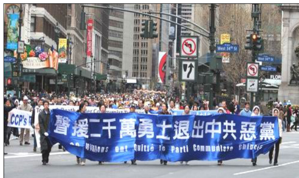
声援两千万勇士退出中共

如今退党大潮已经超过二千多万人, 自古明人和圣者做事都是顺天意而行的, 不要一再错过机缘, 不能违背天意, 看清眼前形势, 做出明智选择。