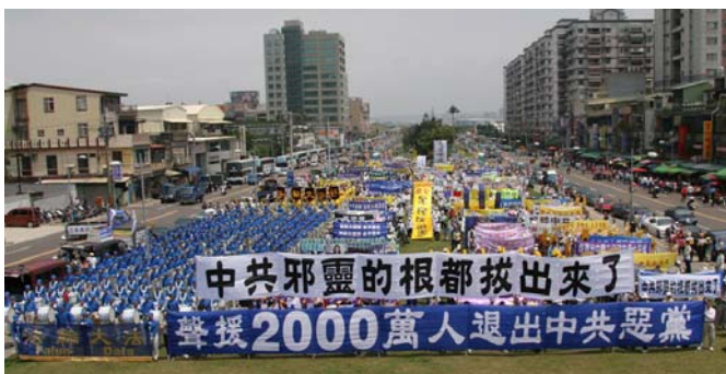
世界各地民众游行庆祝退党团队人数超过二千万

您可能说我思想中早退了, 我也不交党费了。那都不算数。因为在那个血旗面前向邪党发毒誓时, 您是说把一生、把生命都献给邪党了。所以只有采取公开的方式退出, 有行为的表示, 才能除掉这么大的毒誓, 才能在天灭中共的时候保平安!