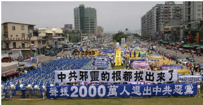
世界各地民众游行庆祝退党团队人数超过二千万

您可能说我思想中早退了, 我也不交党费了。那都不算数。因为在那个血旗面前向邪党发毒誓时, 您是说把一生、把生命都献给邪党了。所以只有采取公开的方式退出, 有行为的表示, 才能除掉这么大的毒誓, 才能在天灭中共的时候保平安!