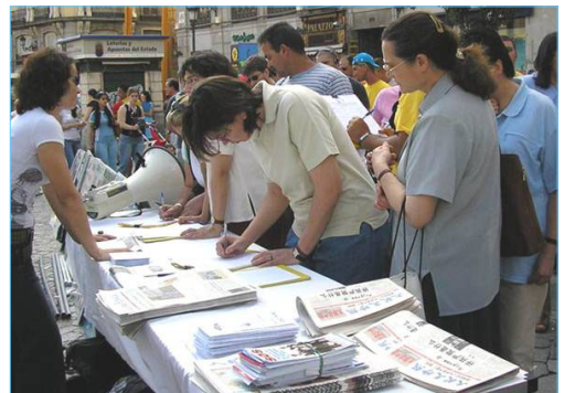
上图：民众踊跃签名支持西班牙法院调查中共犯下的群体灭绝罪。

【明慧网】二零零七年四月十七日，正在出访西班牙的中共政治局常委吴官正被法轮功学员以酷刑折磨和群体灭绝法轮功学员的罪名起诉。自一九九七年起至二零零二年十一月，吴官正任职山东省中共省委书记期间，直接参与并执行了江泽民镇压法轮功学员的指令，在山东省酷刑折磨致死至少上百名法轮功学员。◇