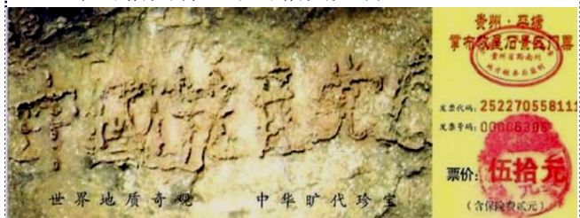
贵州省平塘县掌布乡“藏字石”风景区门票

2002年6月在贵州省平塘县掌布乡发现了一块距今两亿多年的“藏字石”, 五百年前崩裂的巨石断面内自然形成六个繁体大字: 中国共产党亡(下图)。这是上天在警示世人, 天灭中共在即, 顺应了天意, 也为自己选择了光明的未来。常言道: 宁可信其有, 不可信其无啊!