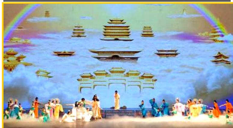
▲全球华人新年晚会美国纽约首场大型舞蹈《创世》剧照