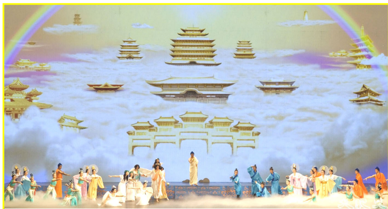
《创世》：主佛率众神佛下世，为苍宇众生开创美好未来。

【明慧网】二月十七日除夕夜，新唐人“全球华人新年晚会”在美国纽约的演出达到高潮，这台世界一流水平的至纯、至善、至美的艺术表演，使现场近六千观众深受震撼。