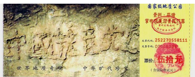
贵州省平塘县掌布乡“藏字石”藏字石门票图案

二零零二年六月，在贵州省平塘县掌布乡发现了2.7亿岁的“藏字石”，五百年前崩裂的巨石断面内显现六个排列整齐的大字“中国共产党亡”，其中那个“亡”字特别的大。中共恶贯满盈，坏事干尽，天要灭中共了。