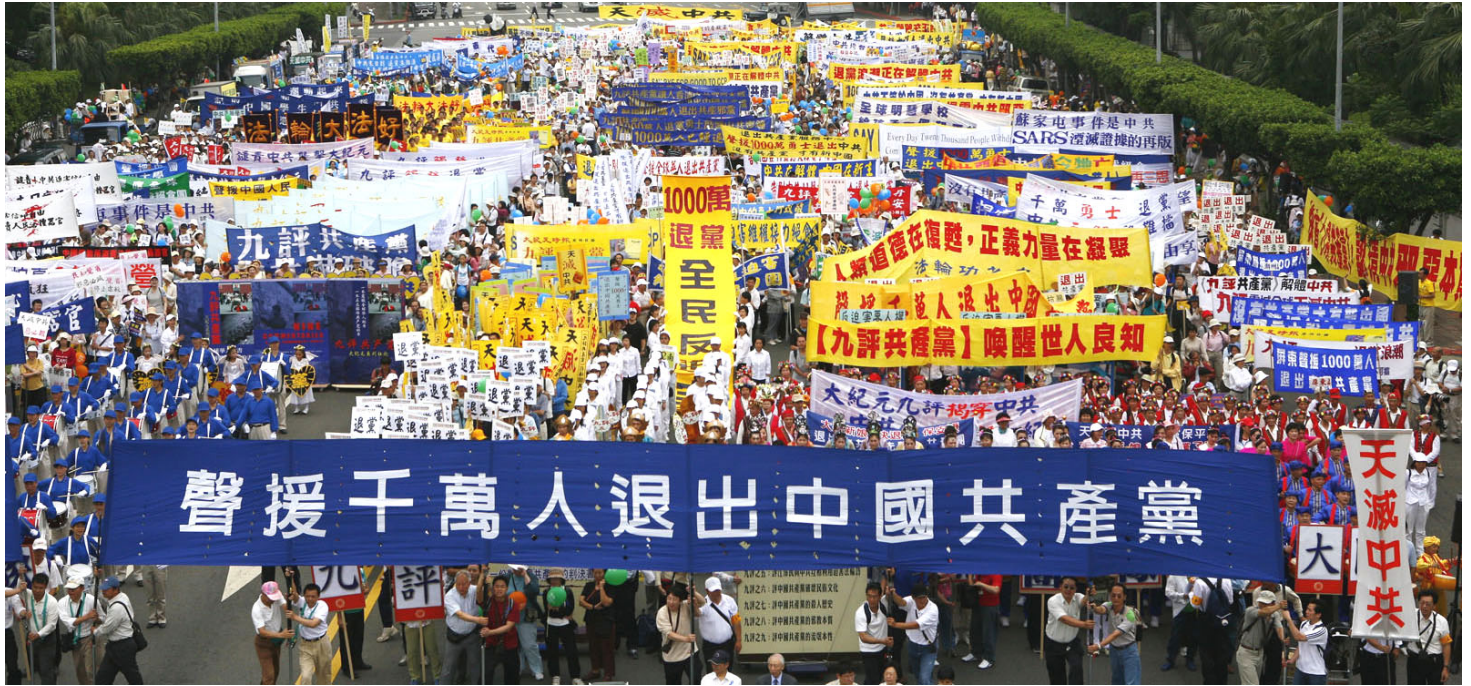
海外民众声援千万中国民众退出中共邪恶组织，天灭中共势不可挡