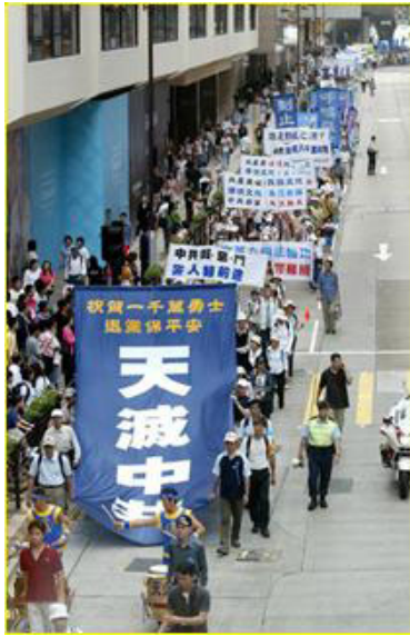
▲“天灭中共”大幡在香港九龙闹市区

来到香港真是大开眼界，这里完全是另外一个世界。对于香港的表面繁华、风土人情、名胜古迹等我无心去赘述，最使我们难忘而又惊奇的是“法轮功”在这里是公开合法的。每到一处都有法轮功修炼人给我们讲真相发传单、送光盘等。特别是海洋公园太热闹了，其中有一段路程约七、八十米两边全是“法轮功”的标语、画展，“天灭共产党、退