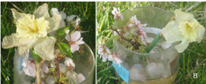
▲十天后的结果：A 花绿叶依旧；B 花已经惨淡

我们从同一棵樱花树上摘下两枝花，略带点叶子，同时再摘了两朵大花，状况几乎一样。然后放在两个一样的瓶子里，装一样的水，一样的多，放在一样的地方。不同的地方在于它们的标签，一个写着：