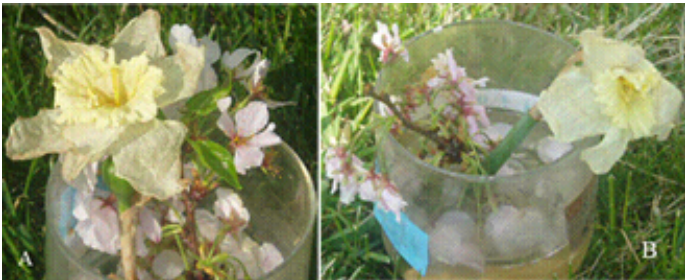
▲十天后的结果：A 花绿叶依旧；B 花已经惨淡

我们从同一棵樱花树上摘下两枝花，略带点叶子，同时再摘了两朵大花，状况几乎一样。然后放在两个一样的瓶子里，装一样的水，一样的多，放在一样的地方。不同的地方在于它们的标签，一个写着：