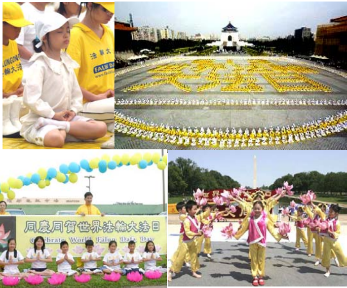
上图：台湾的法轮功学员在台北中正纪念堂广场以五千多名学员排出壮观的“五一三世界法轮大法日”。很多小弟子也带着庄重的神情参加了这次集体炼功。