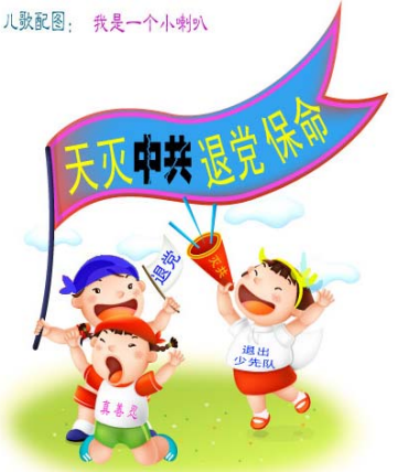
儿歌配图:我是一个小喇叭