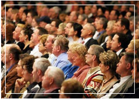
神韵艺术团震动严谨、保守的德国观众

在德国还有另外一个受迫害的团体,那就是犹太人。虽然他们人不生活在德国,但在德国,他们的存在人人都能感觉到,因为每年德国都有纪念二战的重大活动,届时德国总理、总统、各界政要都出席,为在二战中遭受纳粹迫害的犹太人献花圈、默哀,报纸上也头版头条发表大照片。这就是受迫害者:他们为他们自己的经历,为他们的同伴的经历而心情沉重,他们也在不断提醒人们不要忘记。他们的苦难也让人们无法忘记他们。