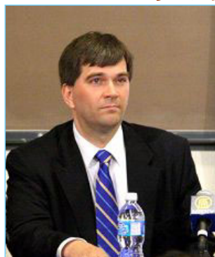
▲反器官摘取组织的发言人特莱医生在论坛上

【明慧网】加拿大蒙特利尔新闻报（The Montreal Gazette）五月十八日报导，一个国际医生组织警告说，国外的病人前往中国进行器官移植时，很可能会移植到从被关押的活人身上摘取的眼角膜、肾脏和肝脏，这些被摘取器官的人会因此死亡。