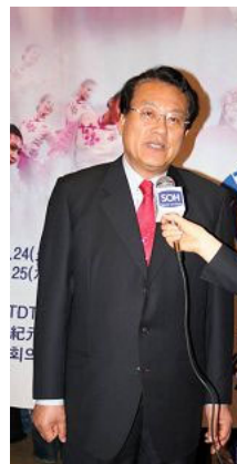
前国会议员、 现任联合国和 平大使金浩一

用由被告方“COEX 剧场”全部承担。演出如期在二十四日到二十六日举办，韩国民众正翘首以待，演出门票几近告罄。