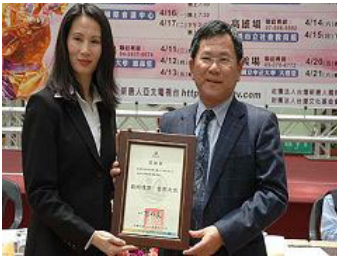
嘉义县长陈明文(右)颁赠感谢状:艺术瑰宝 世界之光

嘉义县长陈明文、市长黄敏惠等对该团以艺术形式宣扬中国传统文化的表现给予高度赞扬,并颁发文化交流感