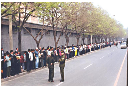
学员没有标语口号，没有阻塞交通。警察无事闲聊天。

4月25日当天，上万名闻讯而来法轮功学员，在上访过程中，既无标语口号，也没有影响交通和民众生活，平静祥和，秩序井然，在北京国务院信访办等候了十几个小时。当时的国务院总理朱镕基接见了学员代表，并指示信访办官员等与法轮功学员代表进行了会谈，后朱镕基，令天津公安局放人，并重申了国家不会干涉群众炼功的政策。