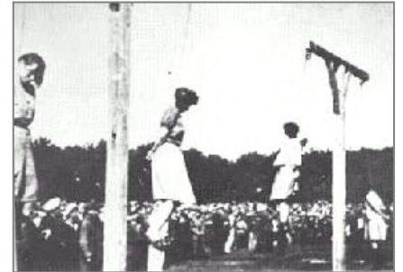
纽伦堡国际战犯法庭经过对纳粹集中营死亡护士组在对犹太人的种族灭绝中所犯罪行的认定，于1946年对她们执行死刑

近来我在网络上也看到了一组历史照片，说的是1946年，纽伦堡国际战犯法庭执行对纳粹集中营死亡护士组的死刑。这位已经加入美国国籍的前党卫军成员和纳粹集中营死亡护士组的成员，在对犹太人的种族灭绝中自愿成为纳粹杀人机器的一部分。这些纳粹分子助纣为虐，都是希特勒叫干的，但是他们并没有因为是希特勒叫他们干的而能够逃避责任。