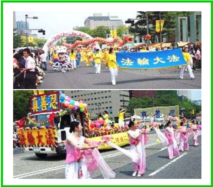
【明慧网】二零零七年广岛鲜花节于五月三日在日

政权的高压迫害下，不畏强权，依然坚持着对真理的信仰，本着大善大忍之心在向世人讲清着真相。在险峻的环境里，法轮功学员没暴力、没有气恨，只有用真善忍的法理，来融化世人那颗冰冻尘封已久的心，体现出的就是风雨中的宁静祥和。