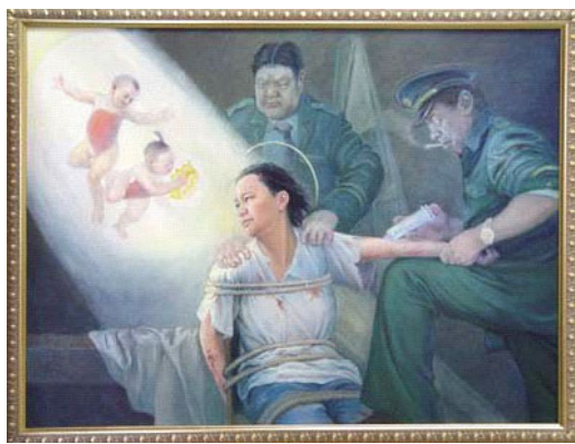
画展作品：光明与黑暗

许多都灵市民在参观完画展后都在问，为什么中共如此对待这些好人？中共一定是太惧怕这些有着无畏勇气的人们了，所以才失去了理智。◇