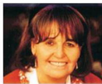
Baroness Caroline Cox