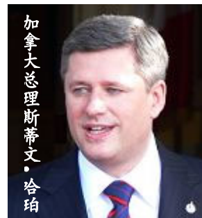
加拿大总理斯蒂文·哈珀

【明慧网】二零零七年五月十三日世界法轮大法日来临之际，加拿大总理斯蒂文·哈珀给法轮功学员发来了贺信，向为国家多元化做出贡献的众多法轮功学员表达诚挚的祝福。以下是贺信译文：