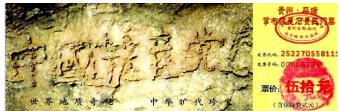
掌布风景区门票上“中国共产党亡”的照片

在贵州平塘县掌布风景区发现了一块二亿七千万年前的藏字石，这块石头自高崖坠地后，一分为二。二零零