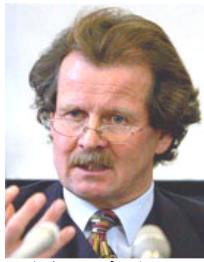
联合国酷刑问题 专员诺瓦克先生

调查指出以下看守所（拘留中心）的工作人员确认被抓法轮功学员的器官被用做移植：黑龙江密山看守所，