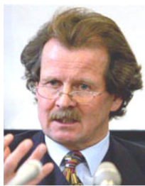
联合国酷刑问题 专员诺瓦克先生

调查指出以下看守所（拘留中心）的工作人员确认被抓法轮功学员的器官被用做移植：黑龙江密山看守所，