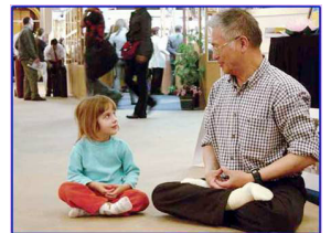
善良无罪,修炼无罪 (海外图片)

在这些年的残酷迫害中,象我这样的大法小弟子,甚至比我还小的失去双亲的小孩子也很多。尽管如此,我坚信:黑暗总会过去,阳光灿烂的日子越来越近。在此,我诚心的向同龄人、向长辈们说句心里话:法轮大法好!信仰“真、善、忍”没有错、没有罪,真心希望你们能早日明白真相,明辨是非,真心希望你们守住人性中善良的一面,让善念而不是让邪党来主宰自己的行为,退出中共,为自己选择一个光明的未来。