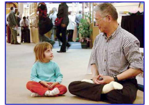
善良无罪,修炼无罪 (海外图片)

在这些年的残酷迫害中,象我这样的大法小弟子,甚至比我还小的失去双亲的小孩子也很多。尽管如此,我坚信:黑暗总会过去,阳光灿烂的日子越来越近。在此,我诚心的向同龄人、向长辈们说句心里话:法轮大法好!信仰“真、善、忍”没有错、没有罪,真心希望你们能早日明白真相,明辨是非,真心希望你们守住人性中善良的一面,让善念而不是让邪党来主宰自己的行为,退出中共,为自己选择一个光明的未来。