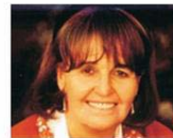
Baroness Caroline Cox