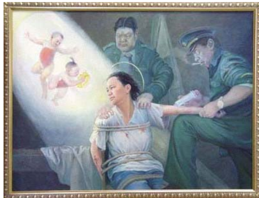
画展作品：光明与黑暗

许多都灵市民在参观完画展后都在问，为什么中共如此对待这些好人？中共一定是太惧怕这些有着无畏勇气的人们了，所以才失去了理智。◇