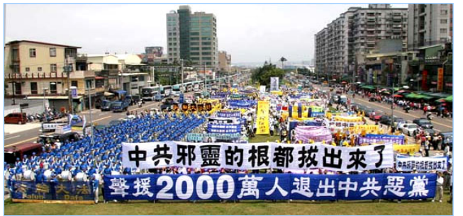
全球声援两千万人退出中共的大型活动已覆盖北美、欧洲及亚洲等十多个国家，声势浩大。图为四月十五日，近四千民众在台湾举行大游行，声援退党潮。

人不治天治，这一切只是天灭红魔的历史大戏的一部份。上天慈悲，在惩治少数不可救要的恶人的同时，也传递着对世人的警示：所有不知醒悟、继续追随中共红魔者都将面临极其危险的惩罚。