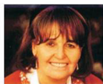
Baroness Caroline Cox