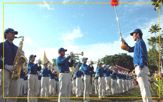
【明慧网】二零零七年五月十九日和二十日，

奉劝世人不要为了一些蝇头小利或一些物质利益就忘却正义良知，真诚待人、与人为善就能远离灾祸与是非，内心的平安是多少钱都买不来的。好人自有神明护佑，恶人最终难逃天惩。