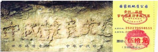
藏字石石照片被印在藏字石风景区门票上

“亡共石”，也许可解谜。 在贵州平塘县掌布风景区发现了一块 2 亿 7 千万年前的藏字石，这块石头自高崖坠地后，一分为二。2002 年 6 月被当地村民发现藏字，藏字可辨有 6 个大字“中国共产党亡”，这是国内一百多家媒体包括新华社中央台等，都有过报导和专题，网上也能搜索到相关照片。 当然，他们都不敢报最后一个字。经专家鉴定，这些字都是天然形成的，从概率来讲是“不可能事件”。 如果用倒退法来看，倘若“亡共石”确是天意，这么大的事要发生，猪叫石能不狂叫吗？ 其实大家多少都有感应。人们当前的热门话题，议论最多的是贪官、人心败坏和退党大潮。党之将亡，怪异丛生，石头异象警示世人逃脱陪葬厄运，赶快退党保命。（文/张杰连）