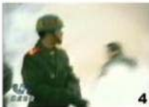
4、击打者仍保持用力姿势