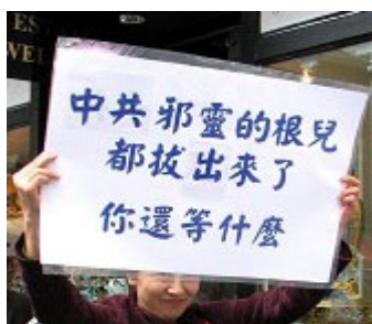
图：海外声援 2200 万中国民众退出中共。

恶报，并不是法轮功修炼者所愿意看到的。写出来不是为了仇恨，是希望仍在参与迫害者能够警醒，引以为戒，正视自己的危险处境。立即停止罪恶行为，并将功补过，赎回自己的未来。