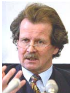
联合国酷刑问题 专员诺瓦克先生

【明慧网二零零七年五月十日】据希望之声电台五月九日报导，在最新公布的二零零七年联合国报告中，收录了联合国人权委员会酷刑问题专员曼弗雷得·诺瓦克的最新报告。他在报告中列举了有关中共活体摘取法轮功学员器官的事实。