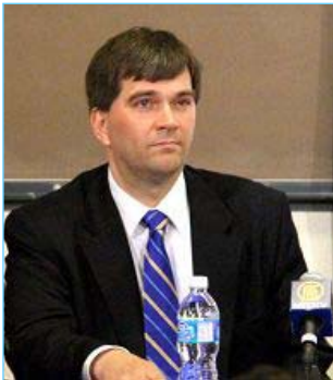
▲反器官摘取组织的发言人特莱医生在论坛上

【明慧网】加拿大蒙特利尔新闻报（The Montreal Gazette）五月十八日报导，一个国际医生组织警告说，国外的病人前往中国进行器官移植时，很可能会移植到从被关押的活人身上摘取的眼角膜、肾脏和肝脏，这些被摘取器官的人会因此死亡。