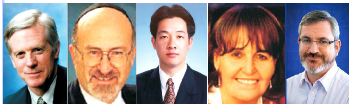
从左至右为加拿大前议员大卫·乔高；北美团长鲁文·鲍克；亚洲团长赖清德；欧洲团长卡罗琳·考克斯；澳洲团长安德鲁·巴列特

【明慧网】关注法轮功人权状况的国际性组织“法轮功受迫害真相联合调查团（CIPFG）”与独立调查员、加拿大前国会议员大卫·乔高，日前致函中国国家主席胡锦涛和国务院总理温家宝，希望他们能在未来两月内结束对法轮功群体和高智晟律师等良心人士的迫害，指出奥运会和属“反人类罪”的迫害在中国同时进行将是全人类的耻辱。