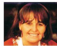
Baroness Caroline Cox